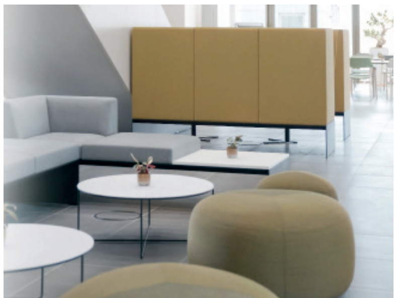
Moderne Büros und Aufenthaltsbereiche im SWE-Neubau.

Auf dem Titel ist unser Neubau zu sehen, den wir Anfang 2023 bezogen haben.