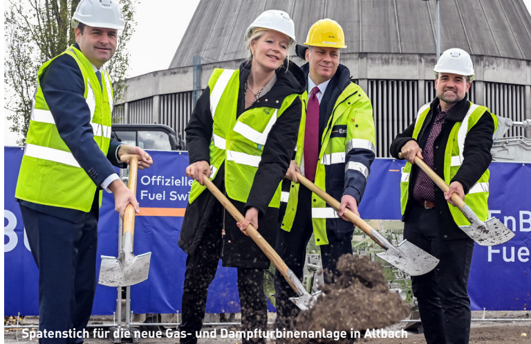
Spatenstich für die neue Gas- und Dampfturbinenanlage in Altbach