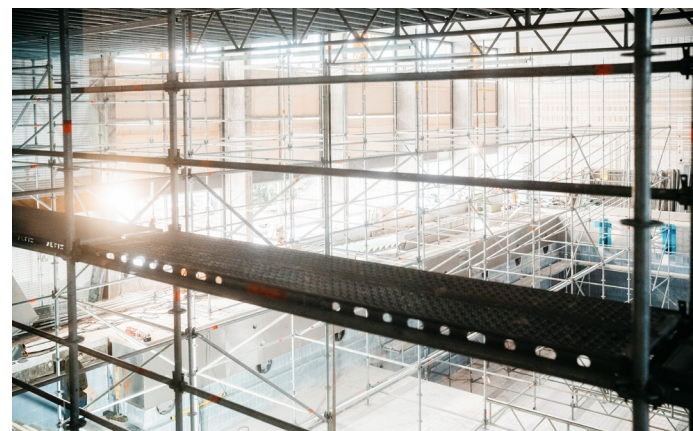
Blick ins eingerüstete Sportbad: Seit Herbst 2023 wird das Merkel'sche Schwimmbad saniert.