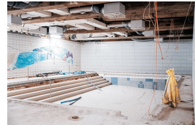
Blick in das Lehrschwimmbaden während der Bauarbeiten: Seit Herbst 2023 wird das Merkel'sche Schwimmbad saniert.

"DIE STADTWERKE ESSLINGEN GESTALTEN KONSEQUENT DIE ENERGIEZUKUNFT VOR ORT."