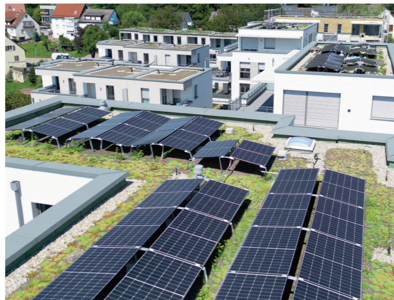
Photovoltaik, Ladeinfrastruktur und Wärme: Die SWE kombinieren innovative und nachhaltige Lösungen für Partner.

Die Stadtwerke Esslingen sind der Partner der Energiewende vor Ort. Gemeinsam mit der Stadt, den Unternehmen und den Haushalten gestalten wir eine sichere, nachhaltige und lebenswerte Energiezukunft für Esslingen und die Region. Energiewende heißt ganz besonders: Wärmewende. Wir arbeiten daran, bis 2040 rund 40 Prozent der Esslinger Haushalte mit nachhaltig erzeugter Wärme zu versorgen. Dieses Ziel verfolgen die SWE konsequent und bauen ihre Wärmenetze zügig weiter aus. Auch in der Region sind wir aktiv – etwa mit der Planung neuer Wärmenetze in Wendlingen am Neckar. So kommt die Energiewende Schritt für Schritt voran.